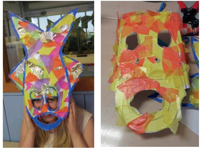
Maskers van gecombineerde materialen te zien op onderstaande afbeeldingen: